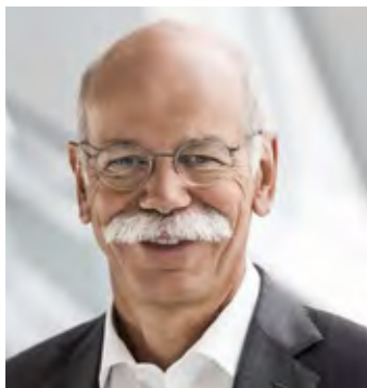
Dr. Dieter Zetsche, Vorsitzender des Vorstands der Daimler AG, Leiter Mercedes-Benz Cars, Daimler AG | Mercedes-Benz Cars

„Im Mercedes sitzen immer mehr Frauen hinter dem Steuer, und auch bei Mercedes kommen immer mehr Frauen ans Steuer! Der Anteil von Frauen im Daimler-Vorstand liegt mittlerweile bei 25 Prozent. Die Zeiten reiner „Gentlemen's Clubs“ in den Führungsebenen sind längst vorbei. Gut so! Deshalb bin ich der Einladung des CeU gerne gefolgt. Ein Abend, der ganz im Zeichen der Ziele des Vereins stand: Mehr Frauen in der Wirtschaft, mehr Europa, mehr Unternehmergeist und mehr Vernetzung.“